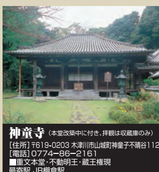
神童寺 (本堂改築中に付き、拝観は収蔵庫のみ) [住所] 〒619-0203 木津川市山城町神童子不講台112 [電話] 0774-88-2161 ■重文本堂・不動明王・蔵王権現 最寄駅 JR柳倉駅