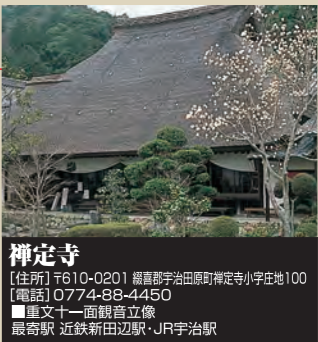
禅定寺 [住所] 〒610-0201 藤原郡宇治田原町禅定寺小学生地100 [電話] 0774-88-4450 ■重文十一面観音立像 最寄駅 近鉄新田辺駅・JR宇治駅