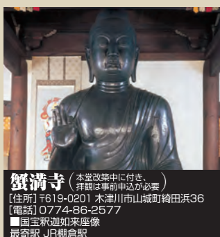
蟹満寺 (本堂改築中に付き、拝観は収蔵庫のみ) [住所] 〒619-0201 木津川市山城町崎田浜36 [電話] 0774-86-2577 ■国宝釈迦如来坐像 最寄駅 JR柳倉駅