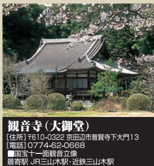
観音寺 (大御堂) [住所] 〒610-0322 京田辺市菟里寺下大門13 [電話] 0774-62-0688 ■国宝十一面観音立像 最寄駅 JR三山木駅・近鉄三山木駅