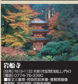
岩船寺 [住所] 〒619-1133 木津川市加茂町岩船上ノ門43 [電話] 0774-76-3390 ■重文三重塔・阿弥陀如来像・普賢菩薩像 最寄駅 JR加茂駅・近鉄奈良駅