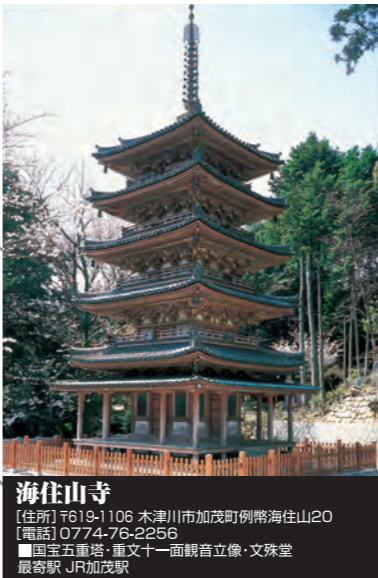
海住山寺 [住所] 〒619-1106 木津川市加茂町例幣海住山20 [電話] 0774-76-2256 ■国宝五重塔・重文十一面観音立像・文殊堂 最寄駅 JR加茂駅