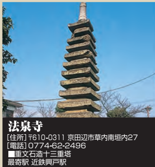
法泉寺 [住所] 〒610-0311 京田辺市草内南内27 [電話] 0774-62-2496 ■重文石造十三重塔 最寄駅 近鉄興戸駅