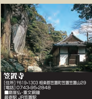
笠置寺 [住所] 〒619-1303 相楽郡笠置町笠置笠置山29 [電話] 0743-95-2848 ■隠座仏・重文銅鐘 最寄駅 JR笠置駅