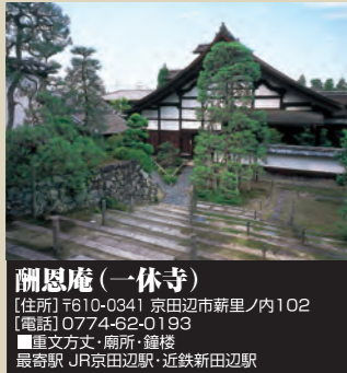
潮恩庵 (一休寺) [住所] 〒610-0341 京田辺市菟里ノ内102 [電話] 0774-62-0193 ■重文方丈・廂所・鐘楼 最寄駅 JR京田辺駅・近鉄新田辺駅