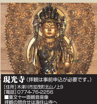
現光寺 (拝観は事前申込が必要です。) [住所] 木津川市加茂町北山ノ上9 [電話] 0774-76-2256 ■重文十一面観音座像 拝観の問合せは海住山寺へ