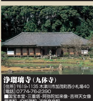
浄瑠璃寺 (九体寺) [住所] 〒619-1135 木津川市加茂町西小札場40 [電話] 0774-76-2390 ■国宝本堂・三重塔・阿弥陀如来像・吉祥天女像 最寄駅 JR加茂駅・近鉄奈良駅

JRのご案内は、 www.jr-odekake.net/ JRおでかけネット http://www.jr-odekake.net/ 近鉄のご案内は、K'sPLAZAへ http://www.kintetsu.co.jp/