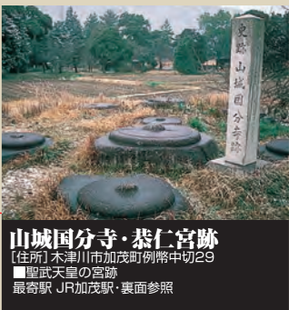
山城国分寺・恭仁宮跡 [住所] 木津川市加茂町例幣中切29 ■聖武天皇の宮跡 最寄駅 JR加茂駅・裏面参照